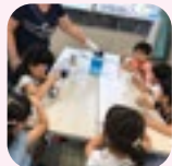
いまに会(学習支援)