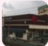
スーパーニコー夏まつり