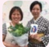
みん里オリジナル絵ハガキ