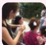
お母さん達が地域行事で活躍