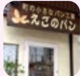
町の小さなパン工房「えごのパン」