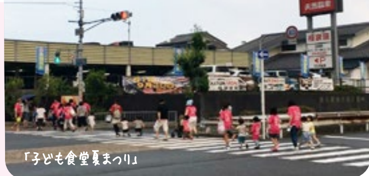
「子ども食堂夏まつり」