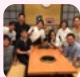
NPO 法人子ども食堂ファンクラブが誕生