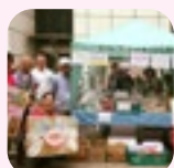
五六市で、あらたなつながり