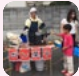
昔なつかしパン菓子