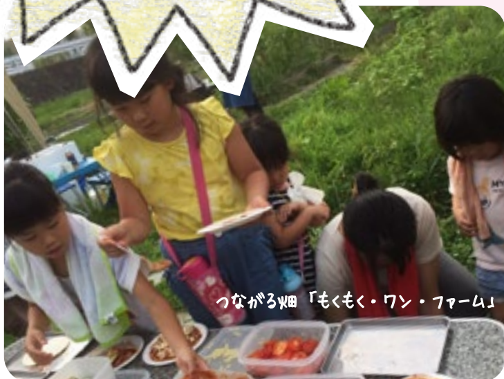
つながる畑 「もくもく・ワン・ファーム」

みんなで作った夏野菜を使って、地域の商店さんの協力を得てピザ作り! 色々な人と垣根をこえてつながることができる畑って、素敵ですね。 そして、一人一人が大切な存在であることに気付かされます。 大地を踏みしめ、風を感じ、人が触れ合う居場所です。子どもから大人まで、お腹いっぱい笑顔いっぱいになりました。