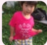
小さな子ども食堂モデル誕生